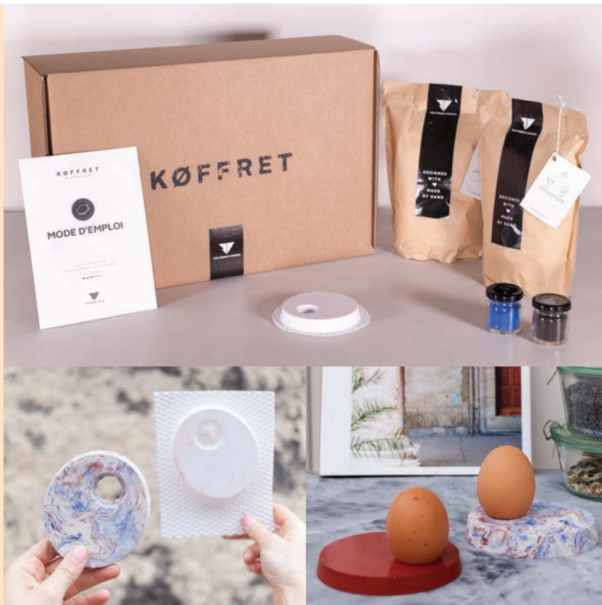
Le mortier très haute performance i.design EFFIX CREA de Ciments Calcia devient "French Béton" conditionné en kit individuel dans les KØFFRETS des French Vikings. 8 objets différents à faire soi-même, comme ici un coquetier.

En 2016, il devenait pictural® avec Fabrice Davenne, qui le tatouait numériquement jusqu'à réaliser, en première mondiale, le plus grand parement en béton imprimé reproduisant sur la façade d'un immeuble une photographie panoramique de 110 mètres de long sur 6 mètres de large ! Cette année, le XXL laisse place au XS, via une nouvelle collaboration des plus inventives avec deux jeunes entrepreneurs qui ont fait du béton leur matériau fétiche, "Les French Vikings". L'idée : un concept inédit de petits objets en béton à réaliser soi-même, dont les kits de préparation individuels sont commercialisés dans des boîtes taille mini, les "KØFFRETS" !